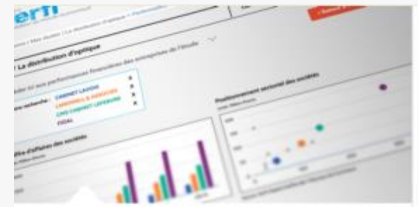
Un portail exclusif pour suivre votre secteur

En plus de l'étude vous accédez en permanence à des vidéos et des flashes sur le secteur et son environnement économique : (conjoncture, état du marché, situation financière, etc...)