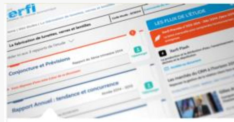
Un flux d'informations tout au long de l'année

L'étude Xerfi FRANCE, c'est 3 tomes (et des mises à jour régulières) pour organiser et hiérarchiser l'information, stimuler votre réflexion et préparer vos décisions.