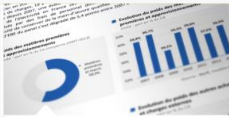
Une étude complète et toujours d'actualité

UNE MÉTHODOLOGIE UNIQUE A LA CROISÉE DE L'ANALYSE ÉCONOMIQUE ET FINANCIÈRE DES ENTREPRISES, DE L'ÉCONOMIE INDUSTRIELLE, DANS UN CADRE MACROÉCONOMIQUE COHÉRENT